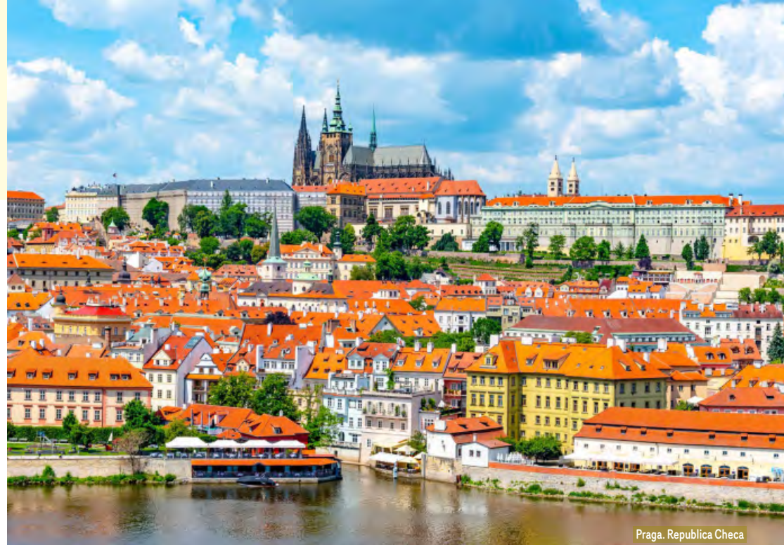
Praga. República Checa