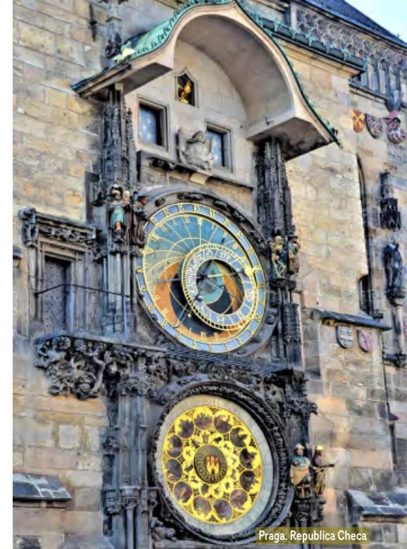
Praga, República Checa